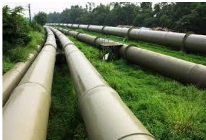
Líneas de flujo superficiales