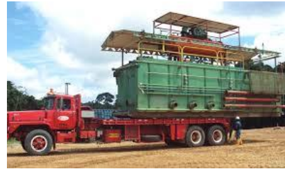
Retiro de sistema de manejo de lodos (Bomba)