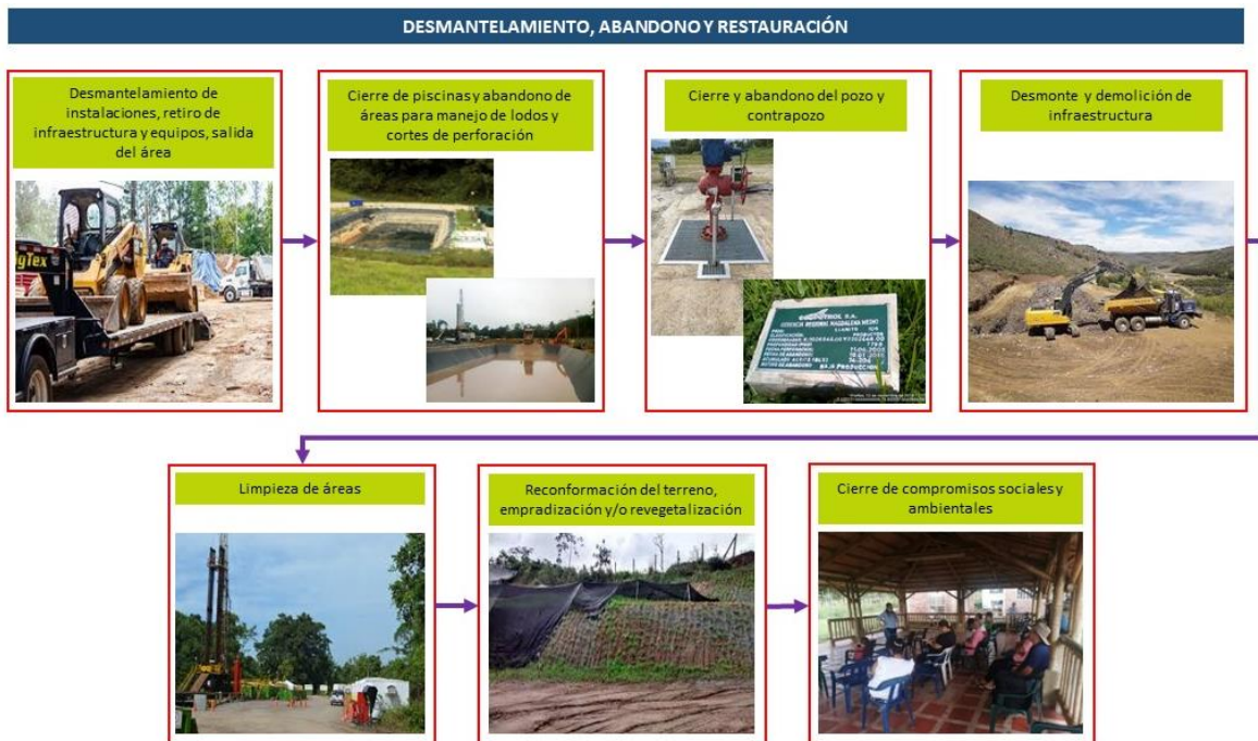
Figura 2.2.3-2 Proceso para la actividad de desmantelamiento, abandono y restauración

En general el proceso, se lleva a cabo siguiendo la hoja de ruta propuesta en la Figura 2.2.3-2 la cual cobija la infraestructura a desmantelar y retirar, así como el cierre de áreas intervenidas.