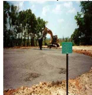
Clausura de las piscinas por sistema de retro llenado

El proceso de desmantelamiento se inicia con el desarme y retiro de los equipos y tuberías de perforación, equipos auxiliares como el del control de sólidos, bombas de lodos, bodegas, campamentos o contenedores de oficinas y talleres; el cual incluye el retiro de todos los equipos, campamentos, líneas eléctricas y telefónicas y demás infraestructura asociada, demolición de todas las estructuras en tierra y áreas cementadas; como son las cunetas, trampas de grasas y skimmer.