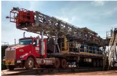
Desmante del Taladro