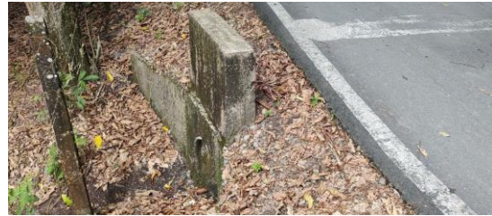
Alcantarilla sencilla \phi 12", Vía V1_1_4