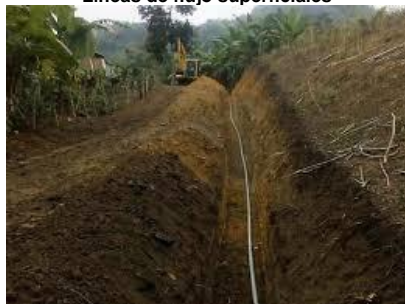
Línea de flujo a desenterrar