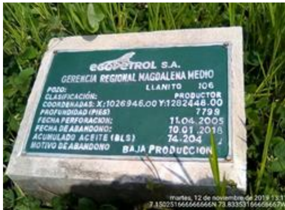
Placa de abandono de un pozo

Finalmente, es aconsejable revisar las acciones de monitoreo o las necesidades de intervención entorno a la gestión de minimización de impactos y reducción del riesgo.