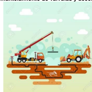
Retiro de tramos de líneas de flujo enterradas