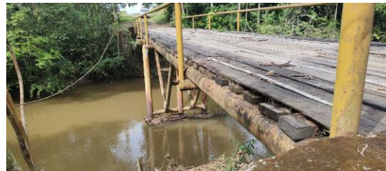
Puente existente en el sitio de captación Cap 1, fin de la Vía V1_1_10