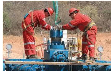
Desmantelamiento de válvulas y accesorios